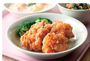
みんなにやさしい鶏からあげ 1kg(30個入)/8袋

厳選した素材を、独自の技術により調理。定評あるニチレイフーズのチキンメニューの中でもひとときわジューシーな人気のおいしさです。