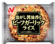
焦がし醤油香るビーフガーリックライス