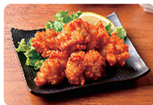
じゅわっと香ばし鶏唐 1kg/6袋

品目コード : 1151200 JANコード : 4902130 115127 ITFコード : 1 4902130 115124